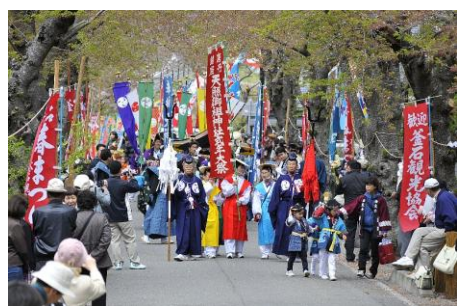
常龍山御神楽【岩手県釜石市】