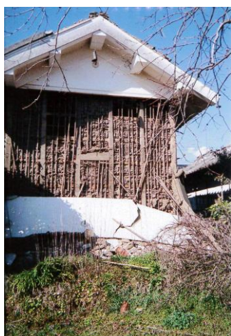
高橋家住宅 土蔵【福島県いわき市】