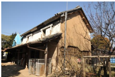
宮本家住宅 大蔵【茨城県つくば市】