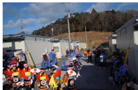
秋葉権現 川原獅子舞【岩手県陸前高田市】