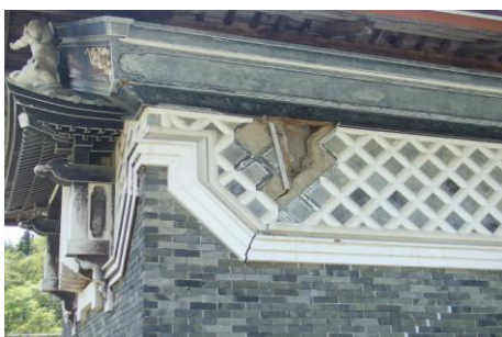
千葉家唐獅子土蔵【岩手県一関市】